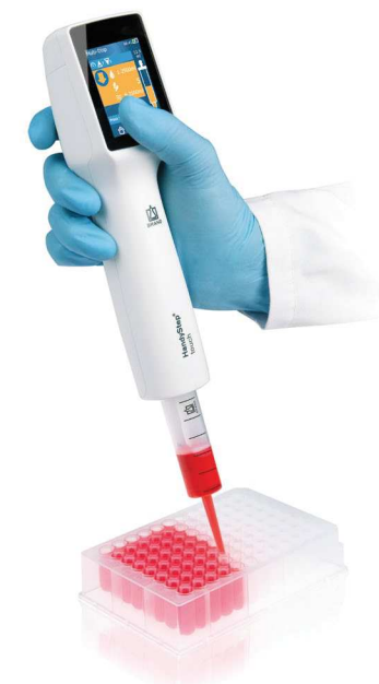
Multi-Dispensieren mit dem HandyStep® touch und PD-Tip //

Der HandyStep® touch spart Zeit und vermeidet Fehler durch die automatische Größenerkennung der PD-Tips // von BRAND mit patentierter Codierung am Kolben. Nach dem Einsetzen wird die erkannte Tip-Größe automatisch angezeigt. Das zu dosierende Volumen kann nun schnell und einfach ausgewählt werden. Die Geräteeinstellung bleibt beim Einsetzen eines neuen PD-Tips gleicher Größe erhalten.