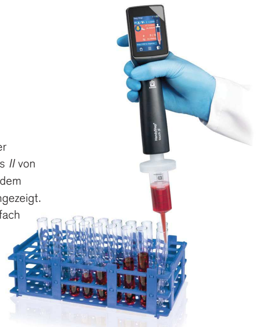
Sequentielles Dispensieren mit dem HandyStep® touch S und PD-Tip //