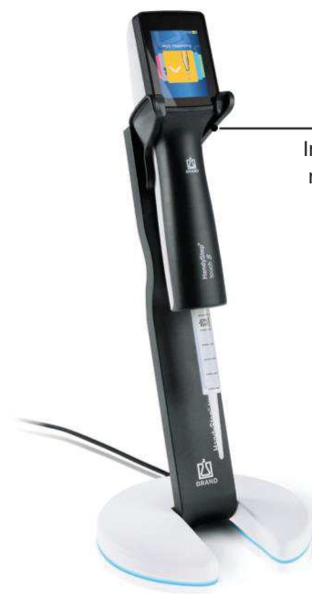
Ladeständer mit HandyStep® touch S und PD-Tip //