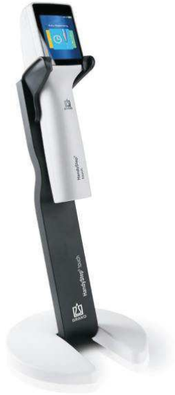
Halteständer mit HandyStep® touch